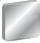
Metalik Gri Ral 9006